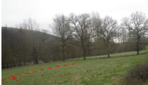
Vue de la laisse d'inondation