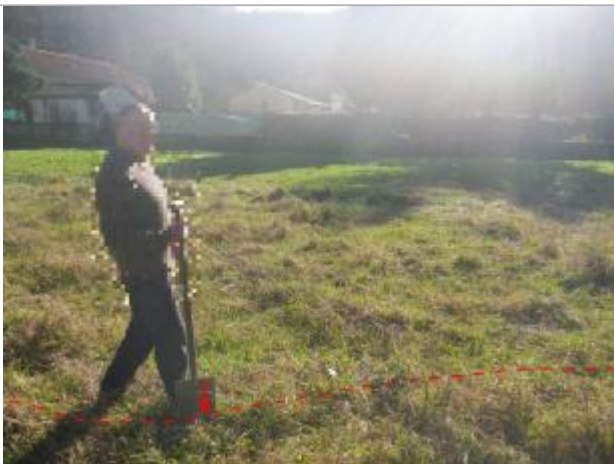
Vue de la laisse d'inondation

Altitude calculée de l'eau (en m) : 247.2309 m