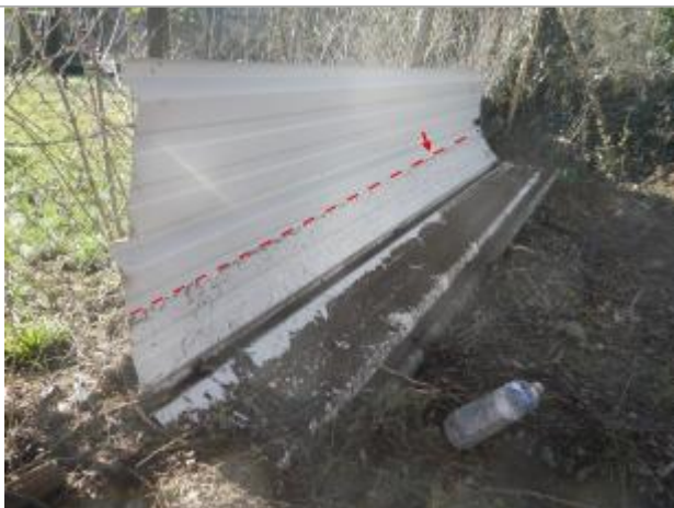
Vue de la laisse d'inondation - Auteur : AGERIN

Altitude calculée de l'eau (en m) : 249.1876 m