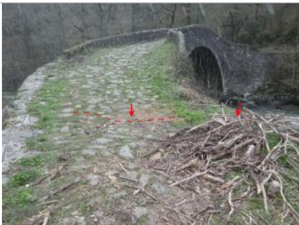
Vue de la laisse d'inondation - Auteur : AGERIN