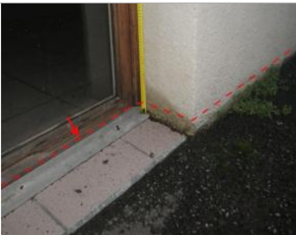
Vue de la laisse d'inondation