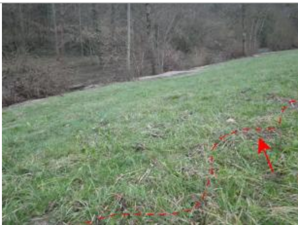
Vue de la laisse d'inondation - Auteur : AGERIN