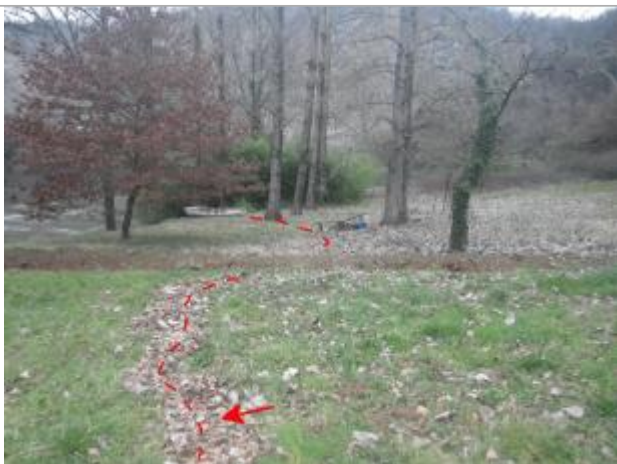
Vue de la laisse d'inondation