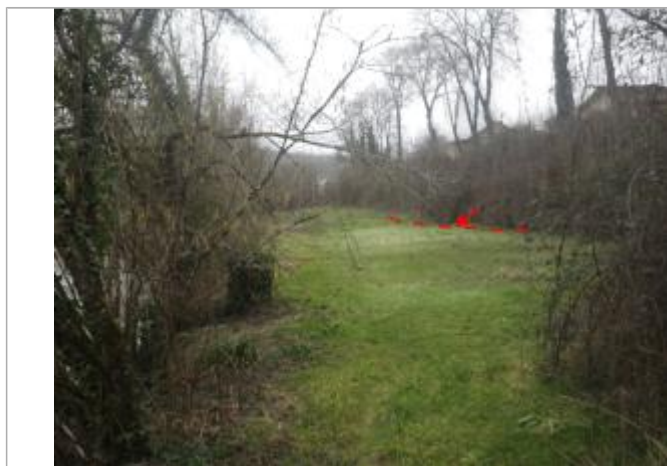
Vue de la laisse d'inondation

Type de repérage : Campagne de terrain post-inondation Organisme : AGERIN