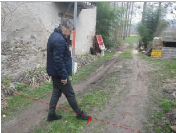
Vue de la laisse d'inondation - Auteur : AGERIN