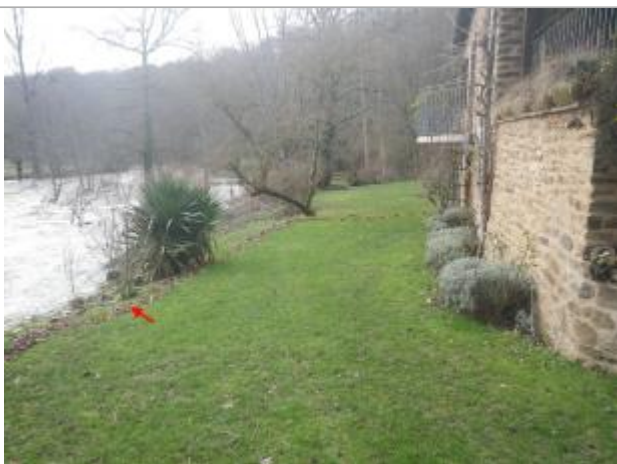
Vue de la laisse d'inondation - Auteur : AGERIN