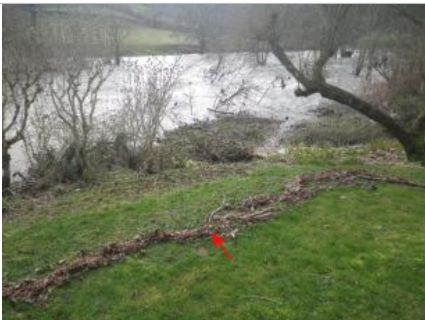
Vue de la laisse d'inondation