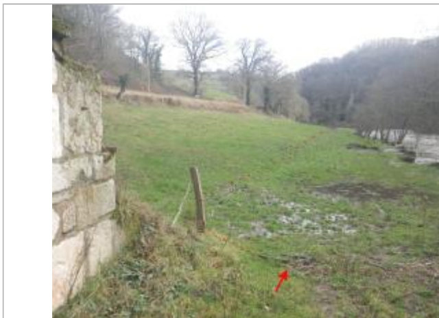
Vue de la laisse d'inondation - Auteur : AGERIN