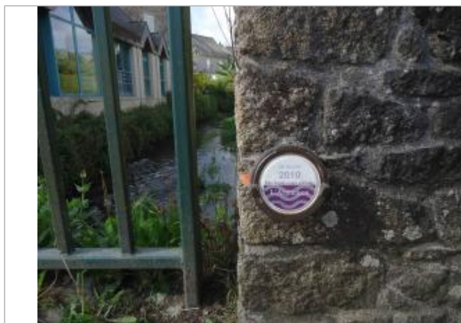
Zoom repère rue du Bourgneuf

Texte : 28 février 2010 / Plus hautes eaux connues / L'Arguenon