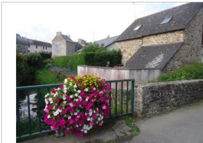
Muret pont du Bourgneuf

Coordonnées WGS84 : X: -2.32395130 / Y: 48.40938600