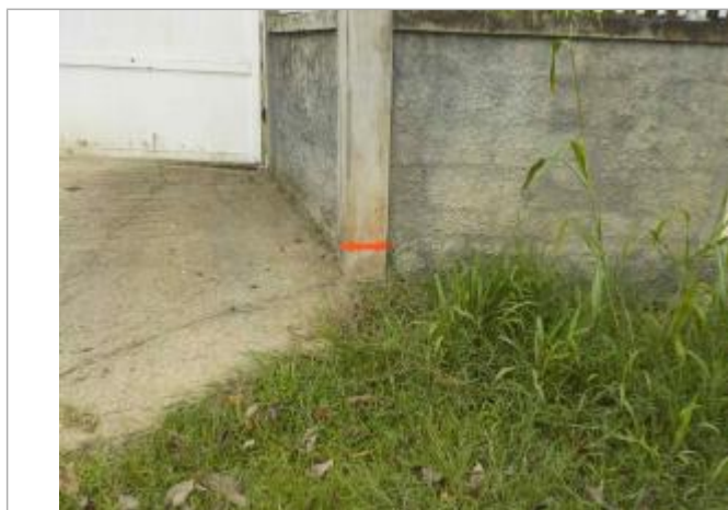
Vue de la PHE