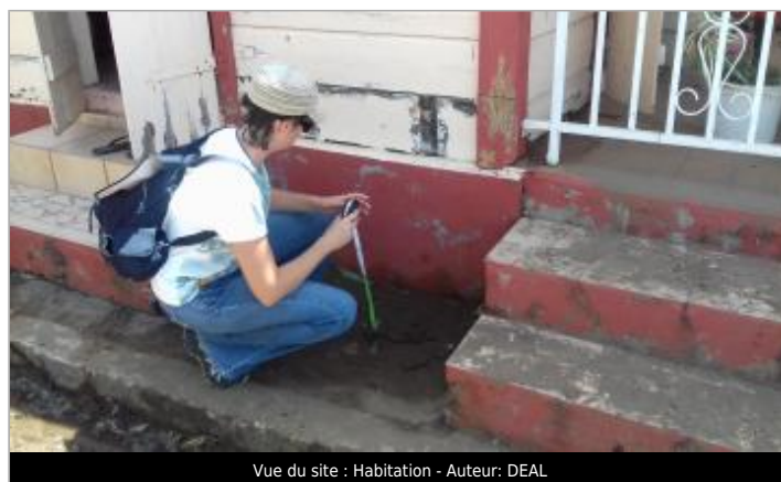
Vue du site : Habitation

GÉOLOCALISATION Coordonnées WGS84 : X: -61.74678800 / Y: 16.01812080 (RRAF 91)UTM 20N X: 634080.15 / Y: 1771344.47 Coordonnées RGF93 (ETRS89) : X: -61.746788 / Y: 16.0181208 Code Hydro: 12120020 Rive de référence: Droite