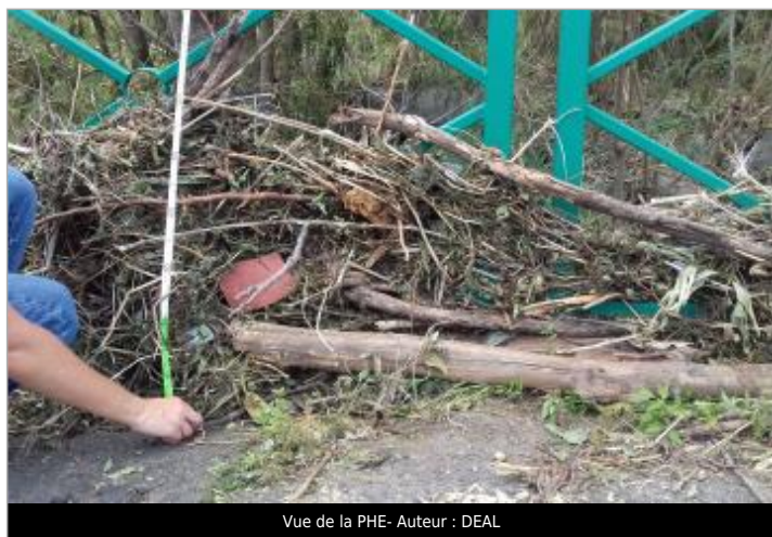
Vue de la PHE- Auteur : DEAL