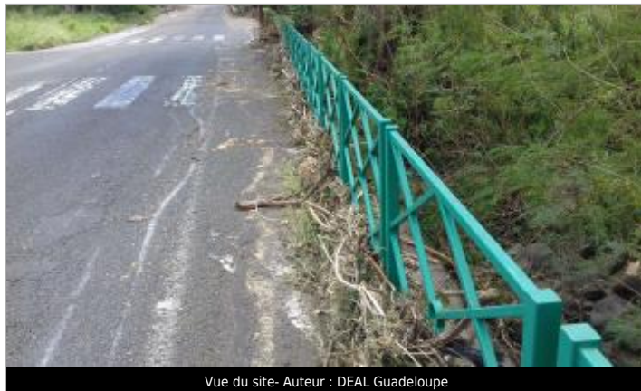
Vue du site- Auteur : DEAL Guadeloupe