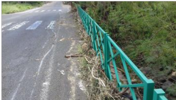
Vue du site- Auteur : DEAL Guadeloupe