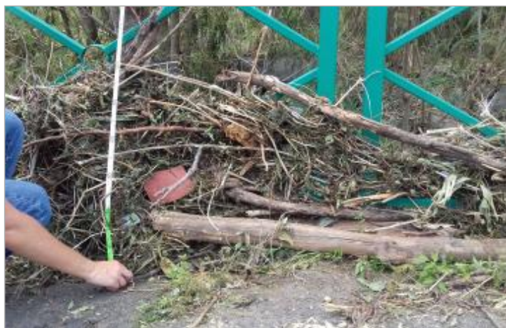
Vue de la PHE- Auteur : DEAL