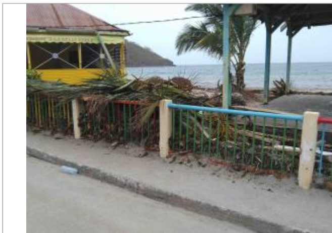
Vue du site : Barrière - Auteurs : DEAL , UAG

Coordonnées WGS84 : X: -61.62464500 / Y: 15.85892000