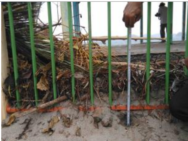
Vue de la PHE

Différence entre le niveau d'eau et la référence (en m) : 0.350 m