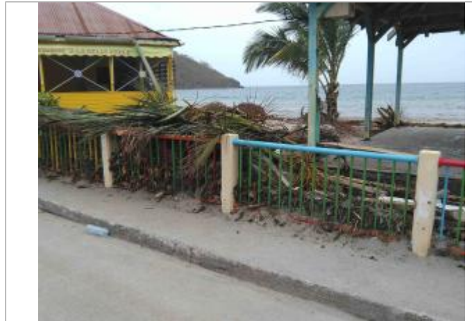
Vue du site : Barrière - Auteurs : DEAL , UAG