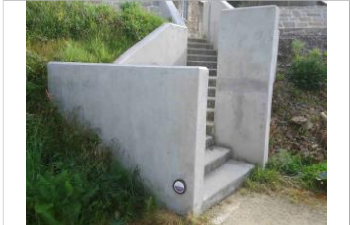
Repère posé en mars 2018

GÉNÉRAL Code : SMAP_2018_R08 Date de mise à jour : 24/03/2020 Auteur : SMAP