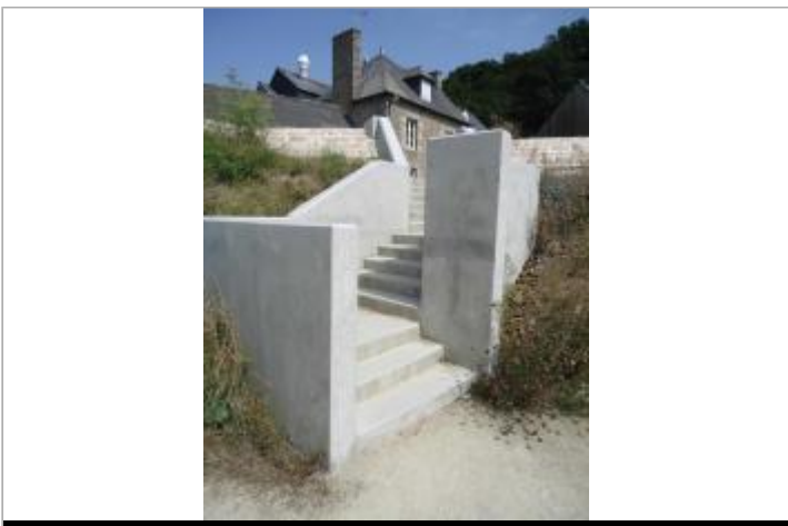
Escalier barrage de la Grande Chaussée

GÉOLOCALISATION Coordonnées WGS84 : X: -2.32088730 / Y: 48.40714500 Coordonnées RGF93 (Lambert 93) X: 306517.46 / Y: 6825135.15 Coordonnées RGF93 (ETRS89) : X: -2.3208873 / Y: 48.407145 Code Hydro: J1114000 Rive de référence: