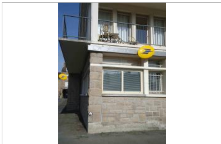
Repère posé en avril 2018