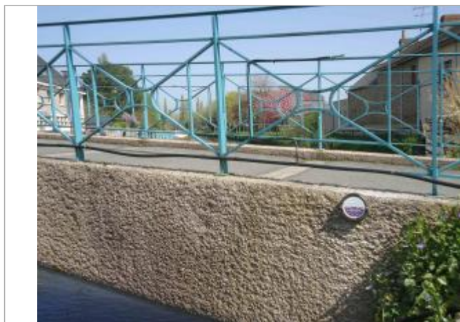
Repère posé en avril 2018

Altitude calculée de l'eau (en m) : 7.94 m