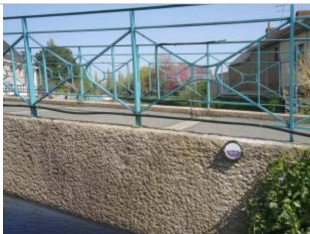
Repère posé en avril 2018

Altitude calculée de l'eau (en m) : 7.94