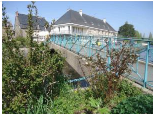
Passerelle piétonne - Source : SMAP, 2018