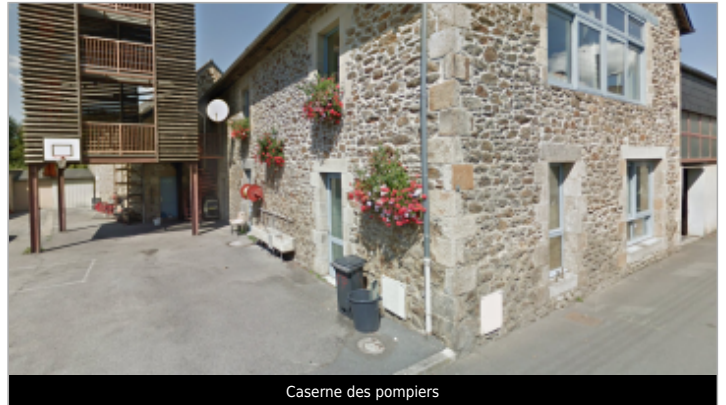
Caserne des pompiers