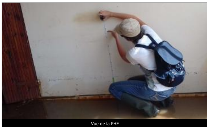
Vue de la PHE