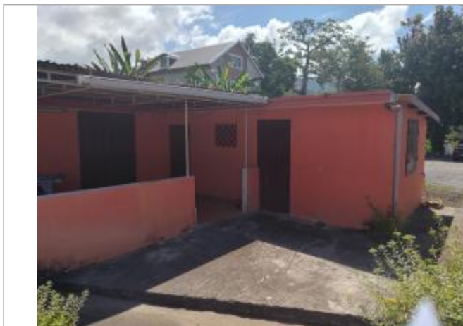
Vue depuis la route

Coordonnées WGS84 : X: -61.77555900 / Y: 16.15425220