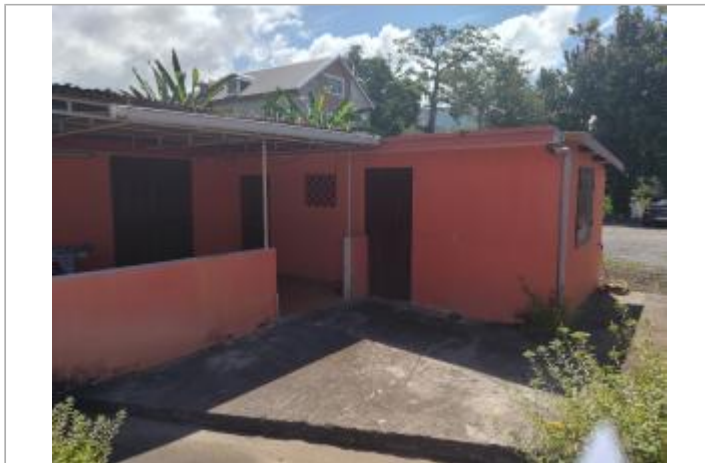
Vue depuis la route