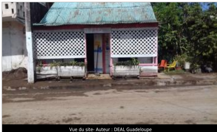
Vue du site- Auteur : DEAL Guadeloupe

Coordonnées WGS84 : X: -61.77545800 / Y: 16.15364010