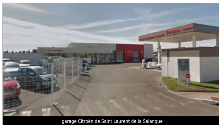
garage Citroën de Saint Laurent de la Salanque