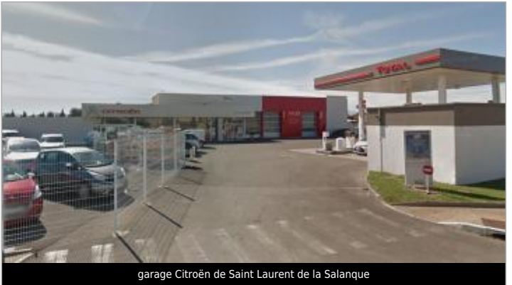
garage Citroën de Saint Laurent de la Salanque

GÉOLOCALISATION Coordonnées WGS84 : X: 3.00047590 / Y: 42.77239400 Coordonnées RGF93 (Lambert 93) X: 700038.99 / Y: 6185873.2 Coordonnées RGF93 (ETRS89) : X: 3.0004759 / Y: 42.772394 Code Hydro: Y06740 Rive de référence: Non renseigné