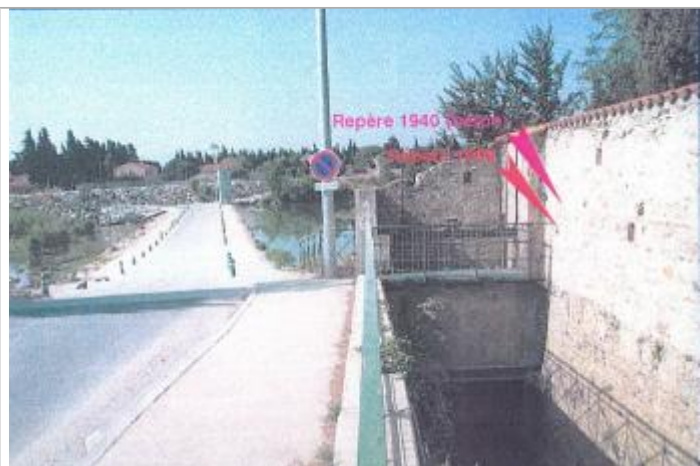
Vue passage à gué, agouille et repères sur mur de clôture du Mas Saint Martin

Altitude calculée de l'eau (en m) : 21.86 m