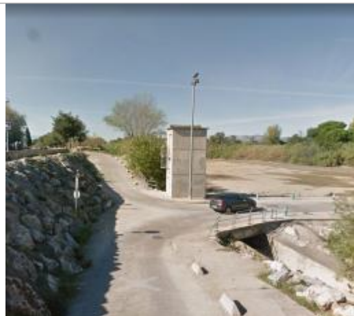
rive gauche poste de relevage à coté du passage à gué

Coordonnées RGF93 (ETRS89) : X: 2.8797656 / Y: 42.773278