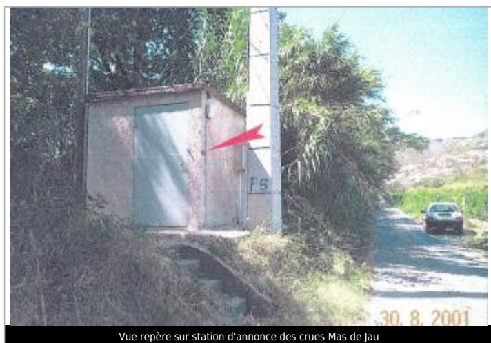
Vue repère sur station d'annonce des crues Mas de Jau

Altitude calculée de l'eau (en m) : 65.84 m