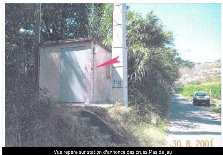
Vue repère sur station d'annonce des crues Mas de Jau

Altitude calculée de l'eau (en m) : 65.84