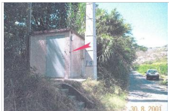
Vue repère sur station d'annonce des crues Mas de Jau

Texte : DDE 12.11.1999 CRUE Maximum de l'inondation : Oui Visibilité : Oui État du repère : Bon Pérennité : Longue Repère calculé : Non PHEC : Non renseigné