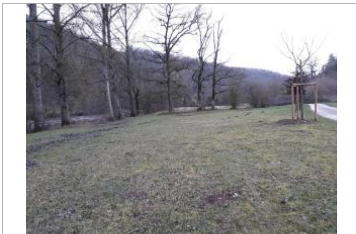
Vue du site - Auteur : Topodoc