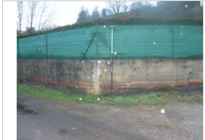
Vue du site - Auteur : Topodoc

Coordonnées WGS84 : X: 2.70933200 / Y: 44.39892390