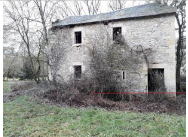
Vue du site - Auteur : Topodoc

Coordonnées WGS84 : X: 2.97530030 / Y: 44.35357570