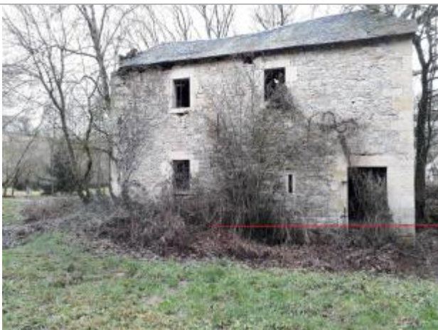
Vue de la laisse - Auteur : Topodoc

Altitude calculée de l'eau (en m) : 621.2152 m