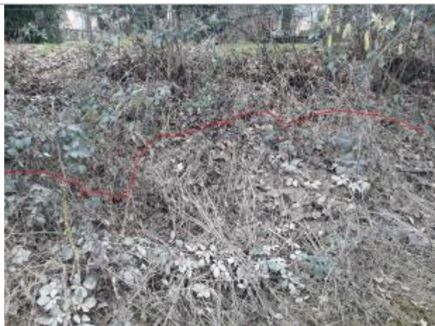
Vue de la laisse - Auteur : Topodoc

Altitude calculée de l'eau (en m) : 541.4814 m