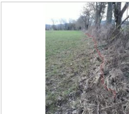
Vue de la laisse - Auteur : Topodoc