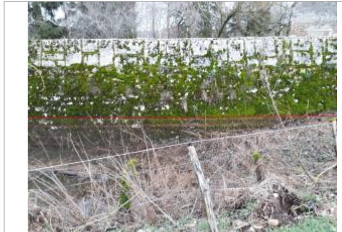
Vue du site - Auteur : Topodoc