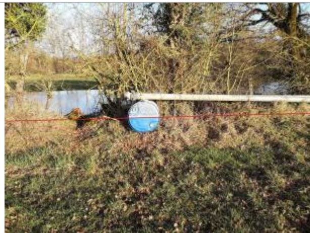
Vue du site - Auteur : Topodoc