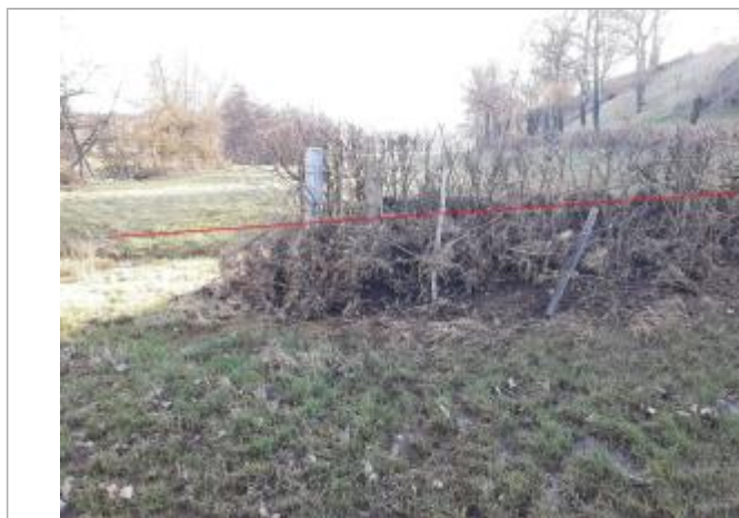
Vue de la laisse - Auteur : Topodoc