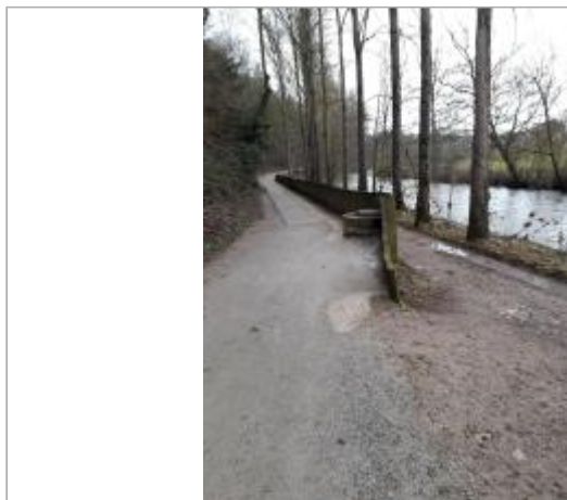
Vue du site - Auteur : Topodoc

Coordonnées WGS84 : X: 2.59404950 / Y: 44.35275120