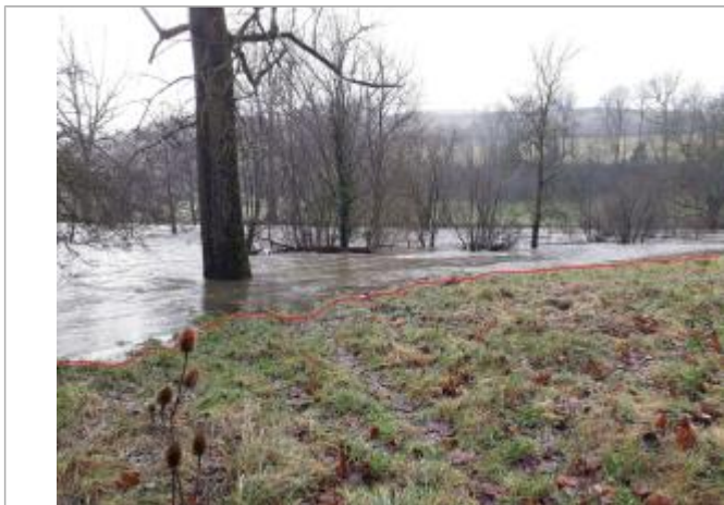
Vue de la laisse - Auteur : Topodoc

Altitude calculée de l'eau (en m) : 508.8072 m