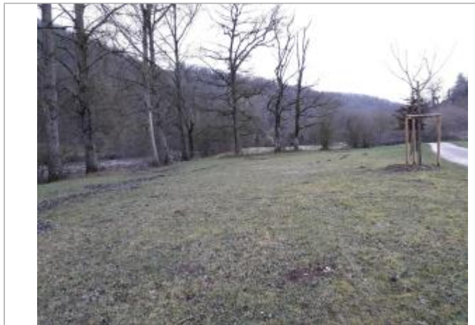
Vue du site - Auteur : Topodoc

Coordonnées WGS84 : X: 2.59640920 / Y: 44.34997680