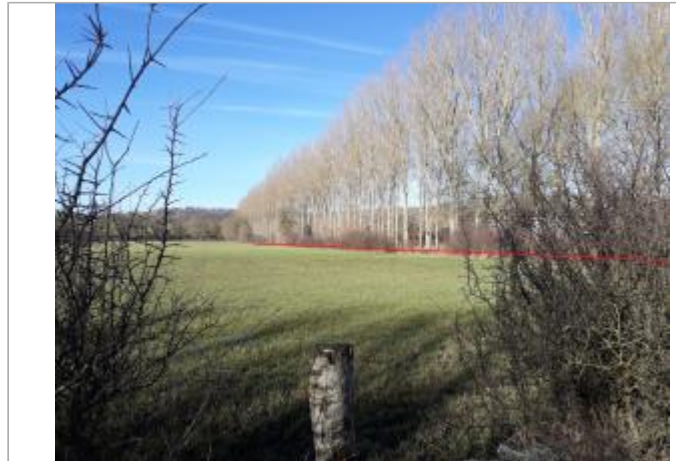
Vue du site - Auteur : Topodoc