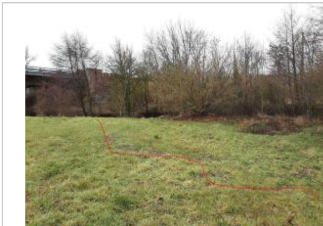
Vue de la laisse - Auteur : Topodoc