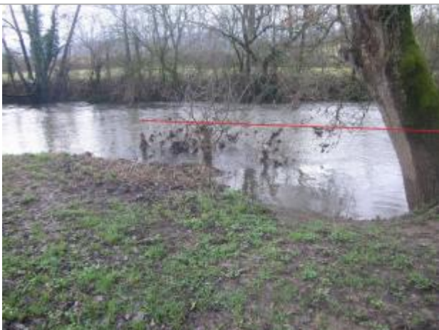
Vue de la laisse - Auteur : Topodoc

Altitude calculée de l'eau (en m) : 570.4248