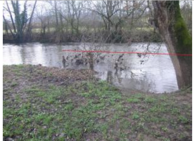
Vue du site - Auteur : Topodoc

Coordonnées WGS84 : X: 2.81806000 / Y: 44.39421290