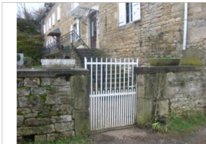
Vue de la laisse - Auteur : Topodoc