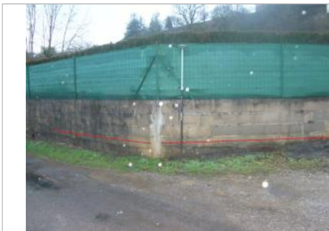
Vue de la laisse - Auteur : Topodoc

Altitude calculée de l'eau (en m) : 552.3283