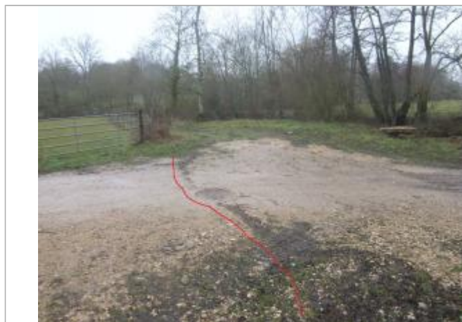
Vue de la laisse - Auteur : Topodoc