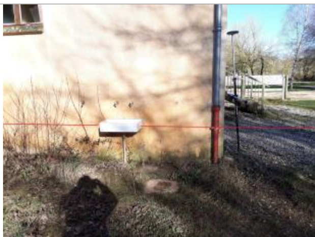
Vue de la laisse - Auteur : Topodoc

Altitude calculée de l'eau (en m) : 551.0215