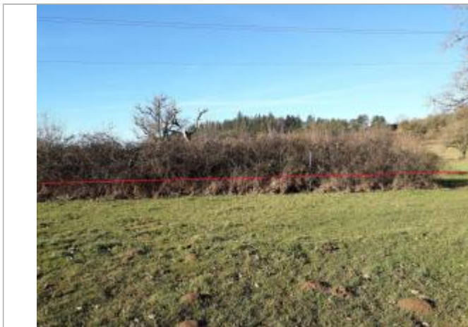
Vue de la laisse - Auteur : Topodoc