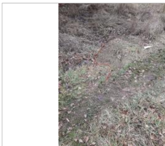
Vue de la laisse - Auteur : Topodoc