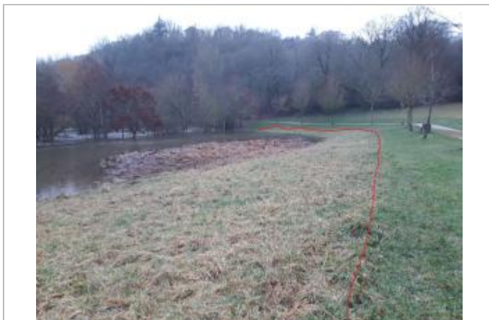
Vue du site - Auteur : Topodoc